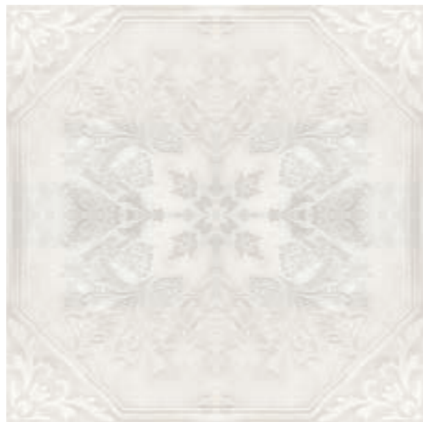
R32A Royale Rosone C4 LUX 120x120

Abbinabile ai fondi / Matching with colours / Mit den Grundfliesen kombinierbar / Peut s'associer aux carreaux de base de couleurs / Puede combinarse con los fondos / Сочетается с фоновой плиткой: