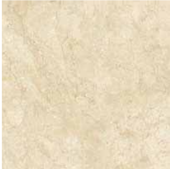
R2XY Royale Marfil LUX rettificato 60x60