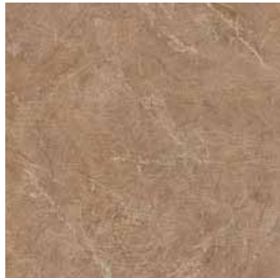
R31H Royale Venato LUX rettificato 60x60