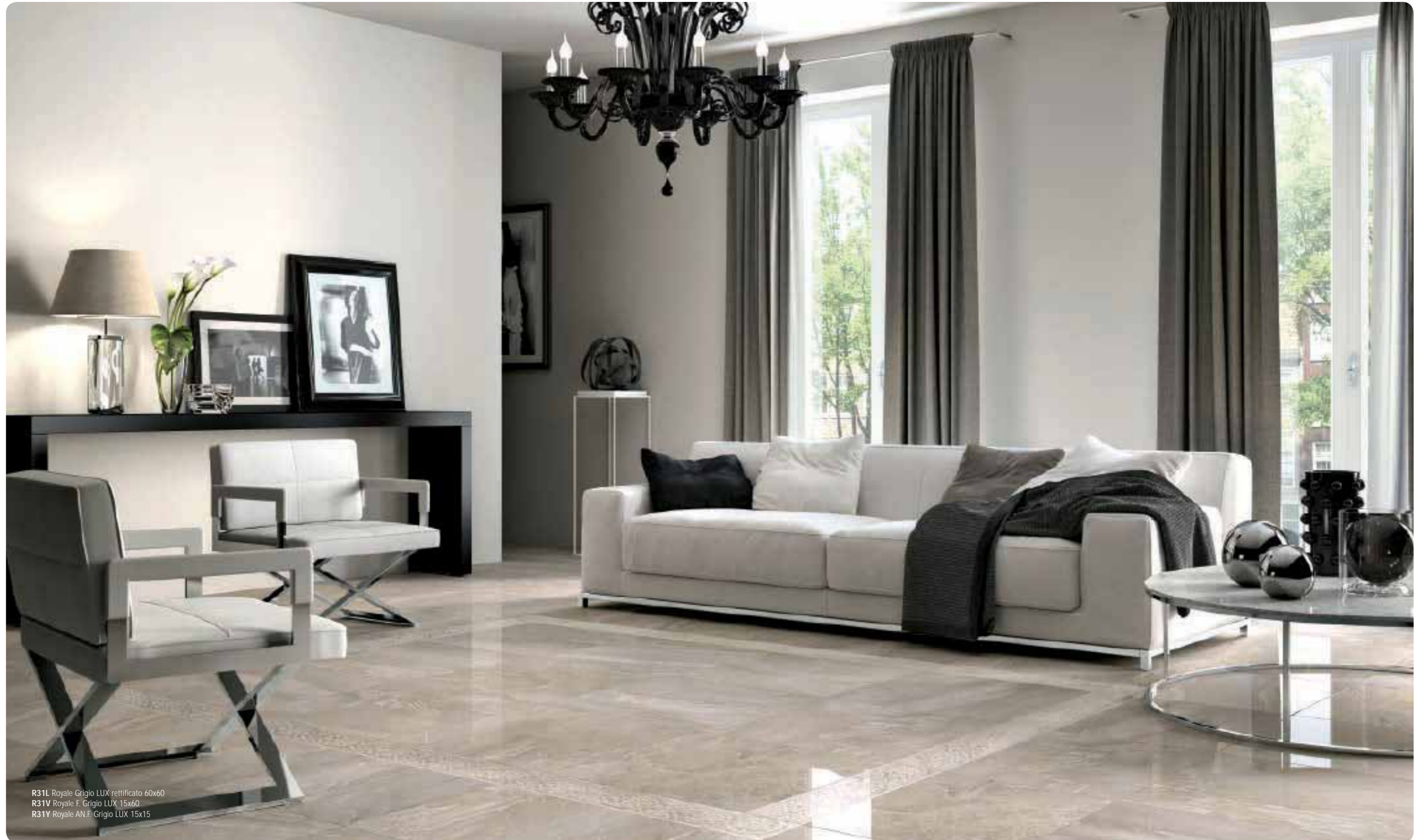
R31L Royale Grigio LUX rettificato 60x60 R31V Royale F. Grigio LUX 15x60 R31Y Royale AN.F. Grigio LUX 15x15