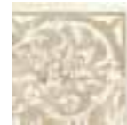
R31W Royale AN.F. LUX 15x15