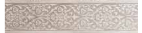
R31V Royale F. LUX 15x60