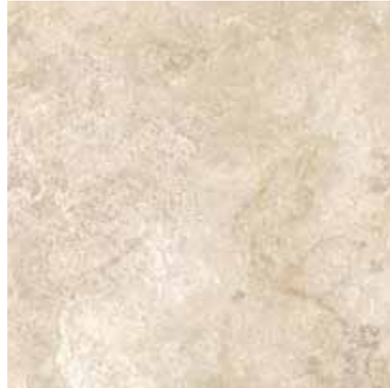
R31F Royale Cremino LUX rettificato 60x60