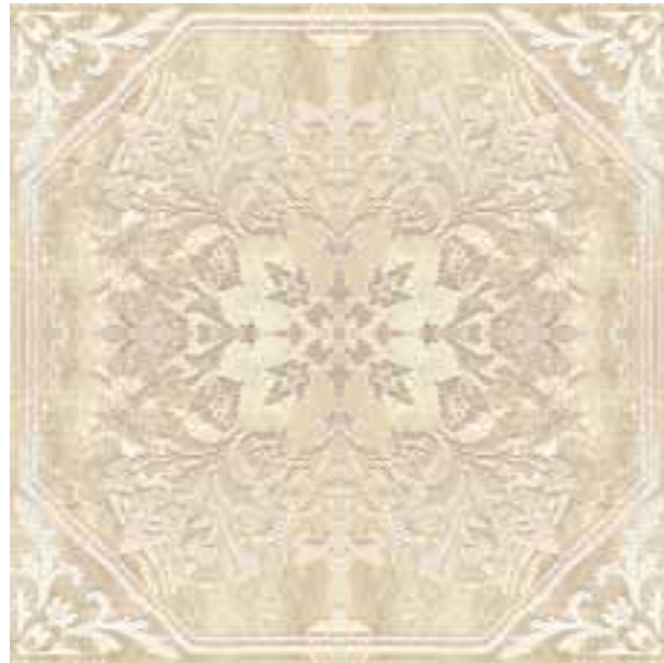
R31Z Royale Rosone C4 LUX 120x120

Abbinabile ai fondi / Matching with colours / Mit den Grundfliesen kombinierbar / Peut s'associer aux carreaux de base de couleurs / Puede combinarse con los fondos / Сочетается с фоновой плиткой: