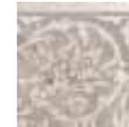
R31Y Royale AN.F. LUX 15x15