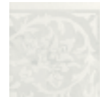
R31X Royale AN.F. LUX 15x15