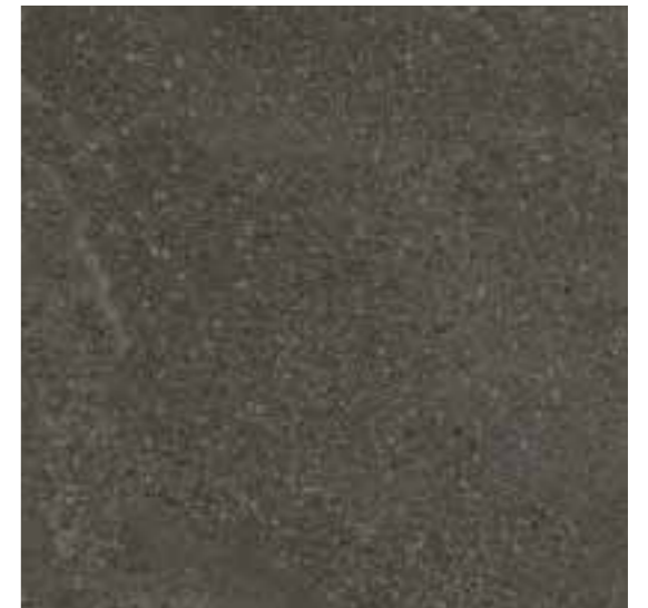
R31M Royale Zimbabwe LUX rettificato 60x60