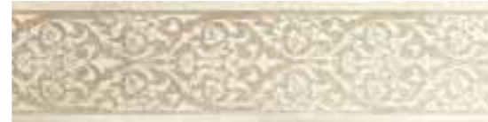
R31T Royale F. LUX 15x60