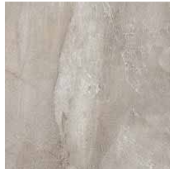
R31L Royale Grigio LUX rettificato 60x60