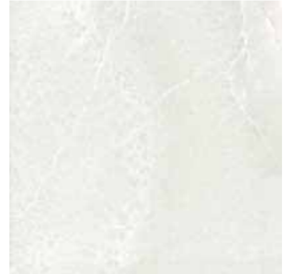
R31K Royale Alabastro LUX rettificato 60x60