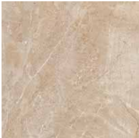
R31G Royale Breccia LUX rettificato 60x60