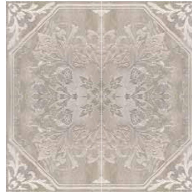
R32C Royale Rosone C4 LUX 120x120

Abbinabile ai fondi / Matching with colours / Mit den Grundfliesen kombinierbar / Peut s'associer aux carreaux de base de couleurs / Puede combinarse con los fondos / Сочетается с фоновой плиткой: