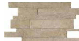
Muretto / HTV 9 30x45 cm 12x18 in 228