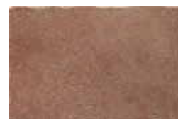
HTV 6 30x45 cm 12x18 in 090