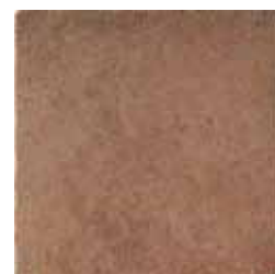
HTV 6 45x45 cm 18x18 in 072