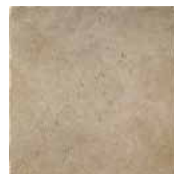
HTV 9 45x45 cm 18x18 in 072