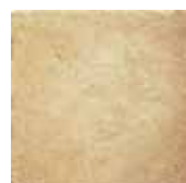
HTV 7 30x30 cm 12x12 in 066