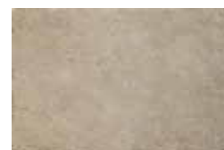
HTV 9 30x45 cm 12x18 in 090