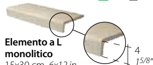
Elemento a L monolitico 15x30 cm 6x12 in 075