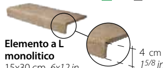
Elemento a L monolitico 15x30 cm 6x12 in 075