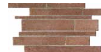
Muretto / HTV 6 30x45 cm 12x18 in 228