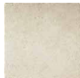
HTV 1 45x45 cm 18x18 in 072