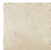
HTV 1 30x30 cm 12x12 in 066