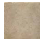
HTV 9 30x30 cm 12x12 in 066