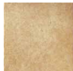
HTV 7 45x45 cm 18x18 in 072