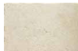
HTV 1 30x45 cm 12x18 in 090