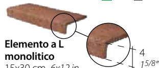
Elemento a L monolitico 15x30 cm 6x12 in 075