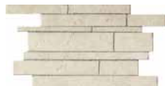
Muretto / HTV 1 30x45 cm 12x18 in 228