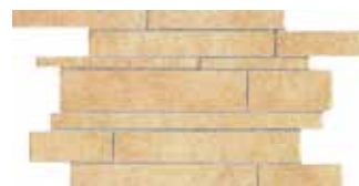
Muretto / HTV 7 30x45 cm 12x18 in 228