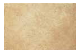
HTV 7 30x45 cm 12x18 in 090