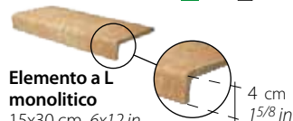
Elemento a L monolitico 15x30 cm 6x12 in 075