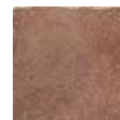
HTV 6 30x30 cm 12x12 in 066