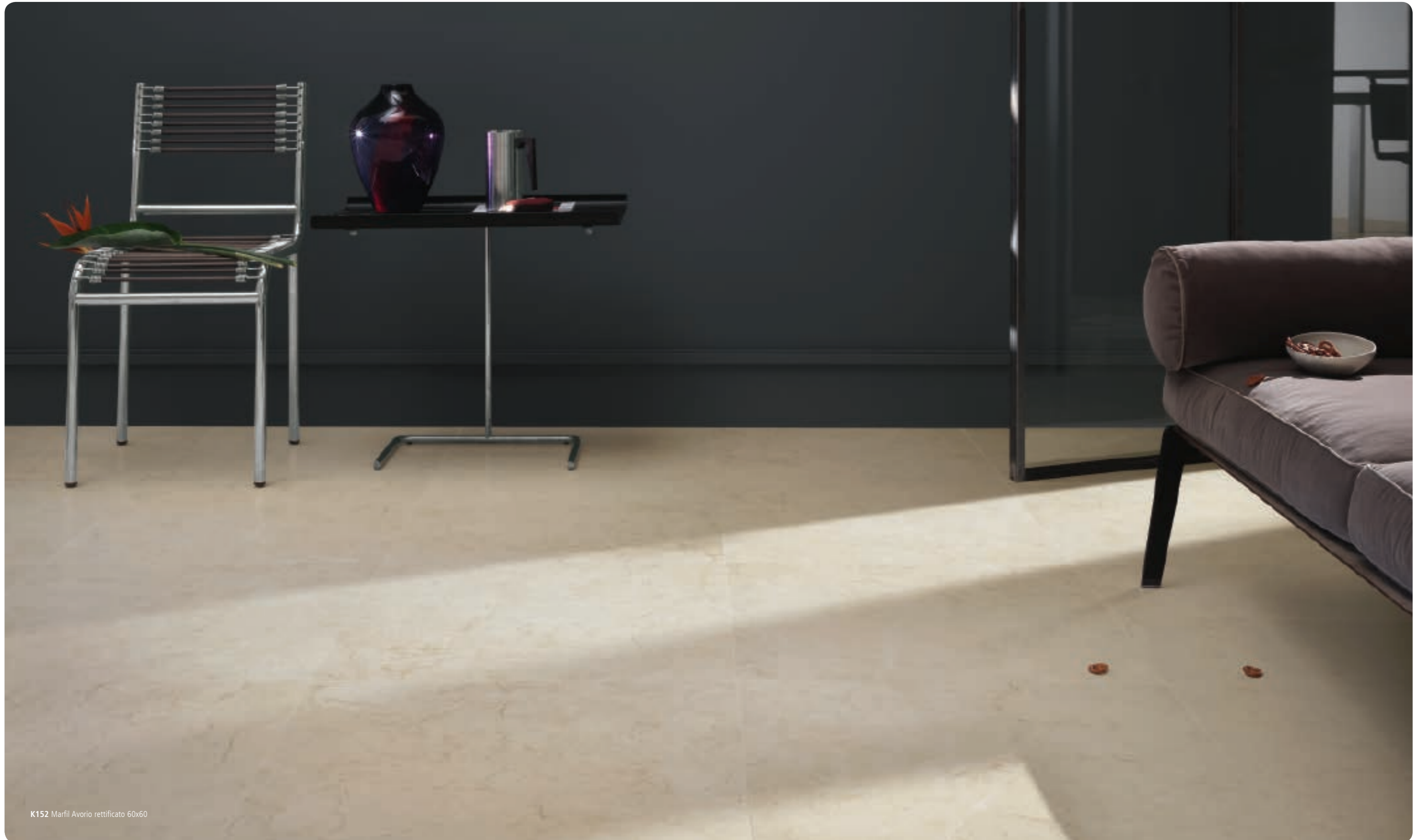
K152 Marfil Avorio rettificato 60x60