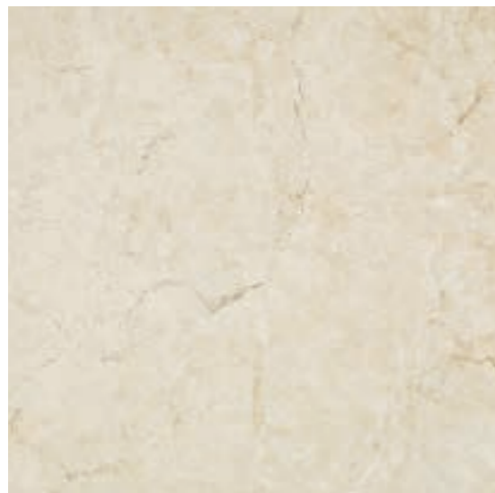
K152 Marfil Avorio rettificato 60x60