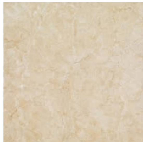
K153 Marfil Beige rettificato 60x60