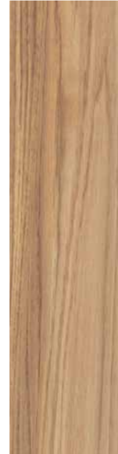
GP 11 20x80 cm 8x32 in 073