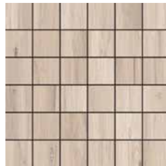
Mosaico / GP 1 30x30 cm 12x12 in 180