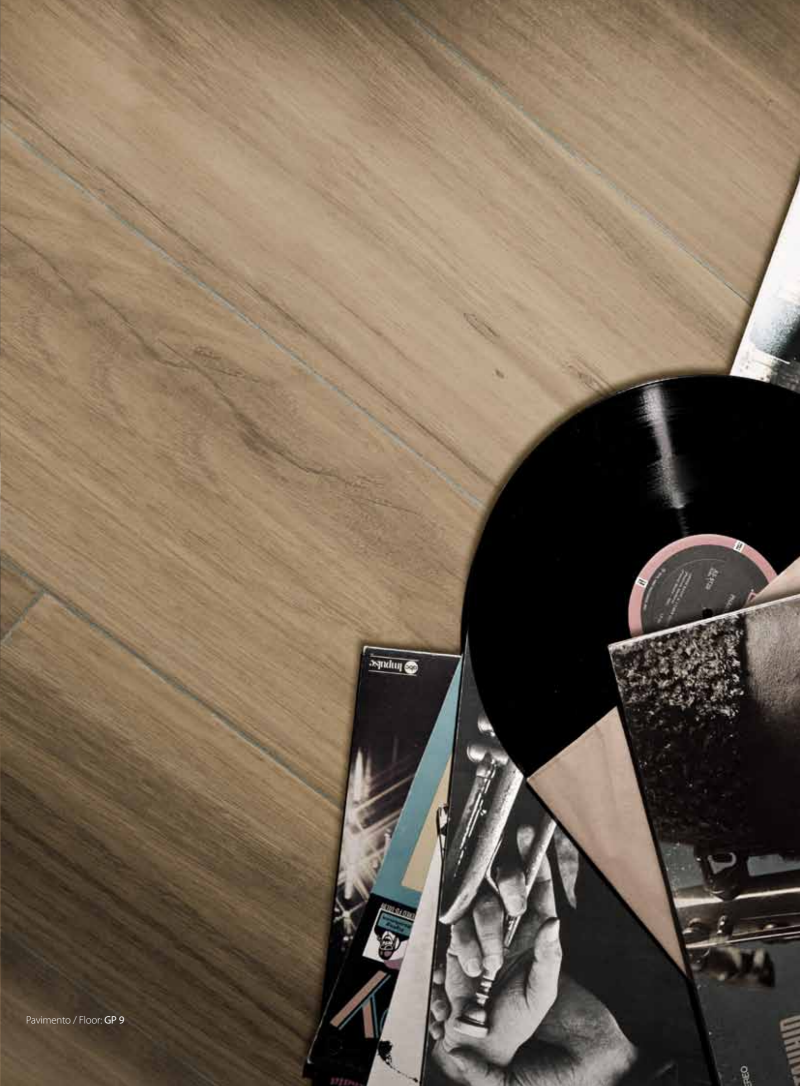
Pavimento / Floor: GP 9