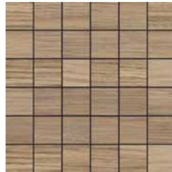
Mosaico / GP 9 30x30 cm 12x12 in 180