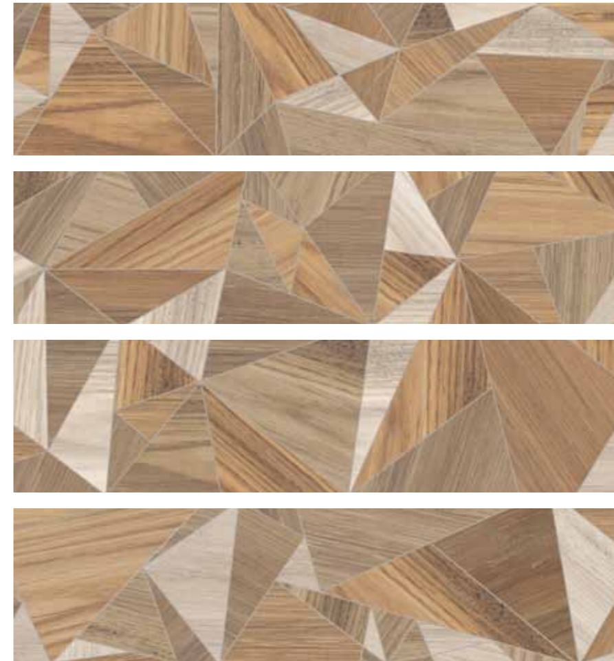
Collodi 20x80 cm 8x32 in 095 • soggetti assortiti • different designs • Motive sortiert • sujets assortis