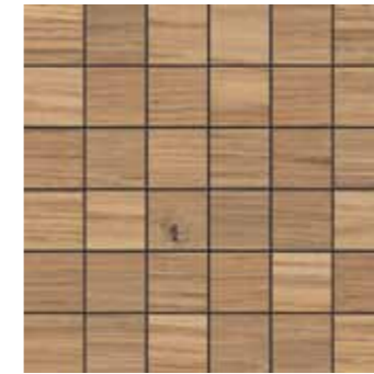
Mosaico / GP 11 30x30 cm 12x12 in 180