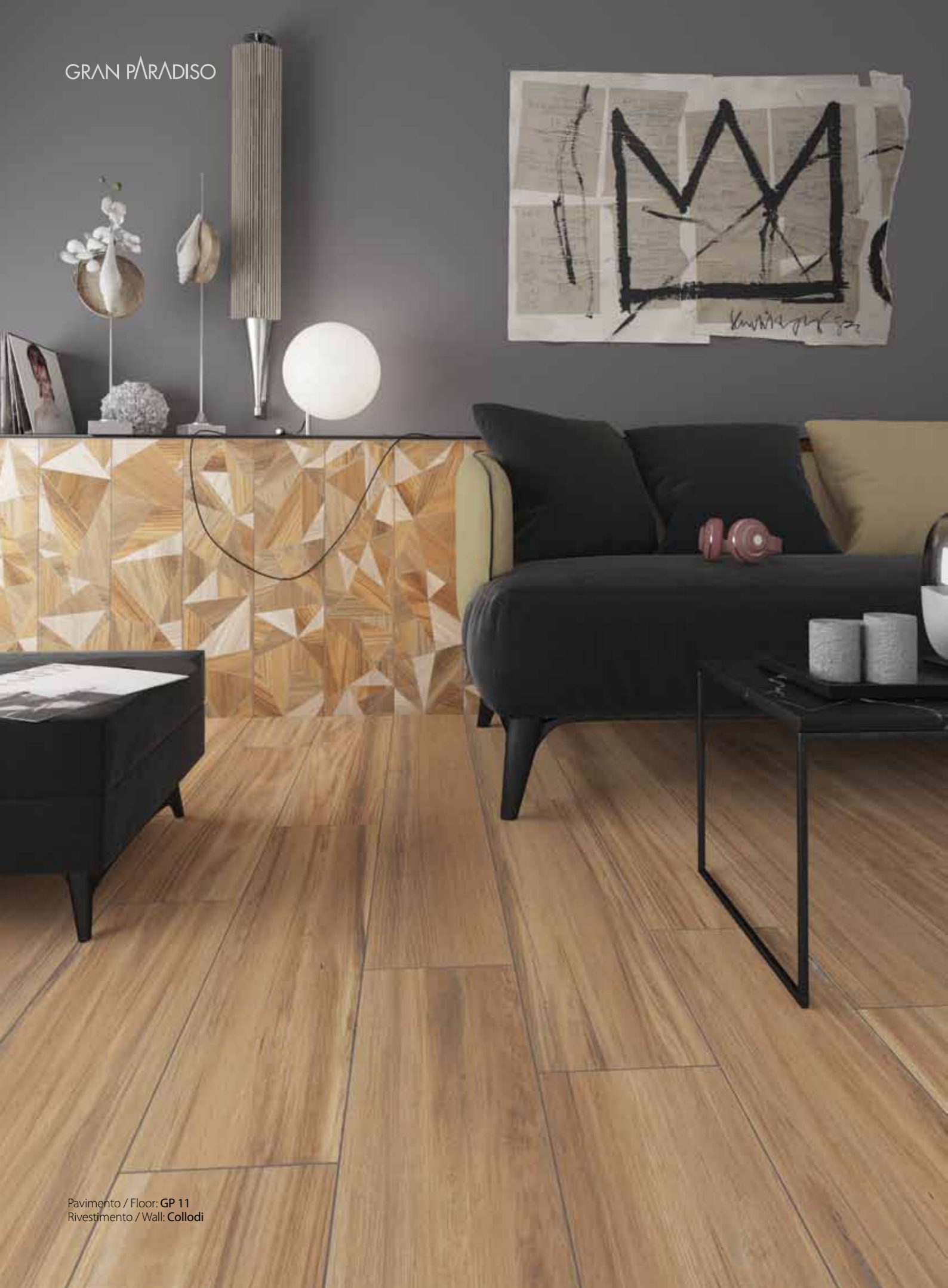
Pavimento / Floor: GP 11 Rivestimento / Wall: Collodi